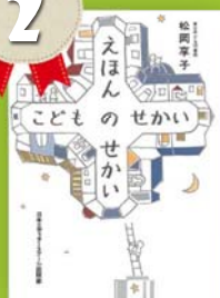
『えほんのせかい こどものせかい』