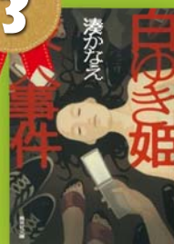
『白ゆき姫殺人事件』 湊かなえ