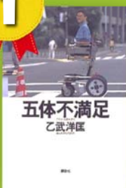
『五体不満足』 乙武洋匡